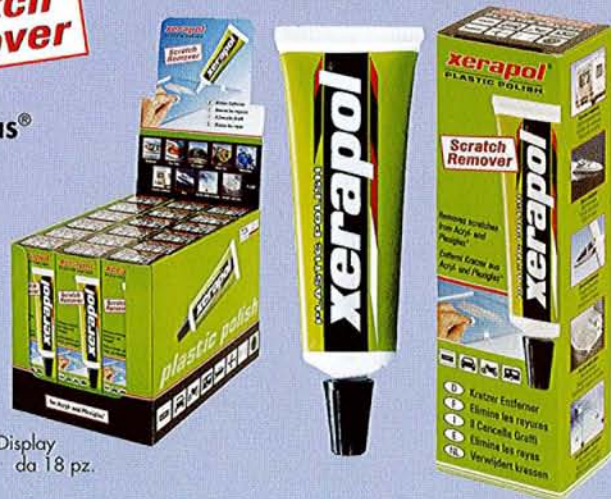
Display da 18 pz.