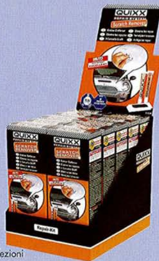
Display da 10 confezioni